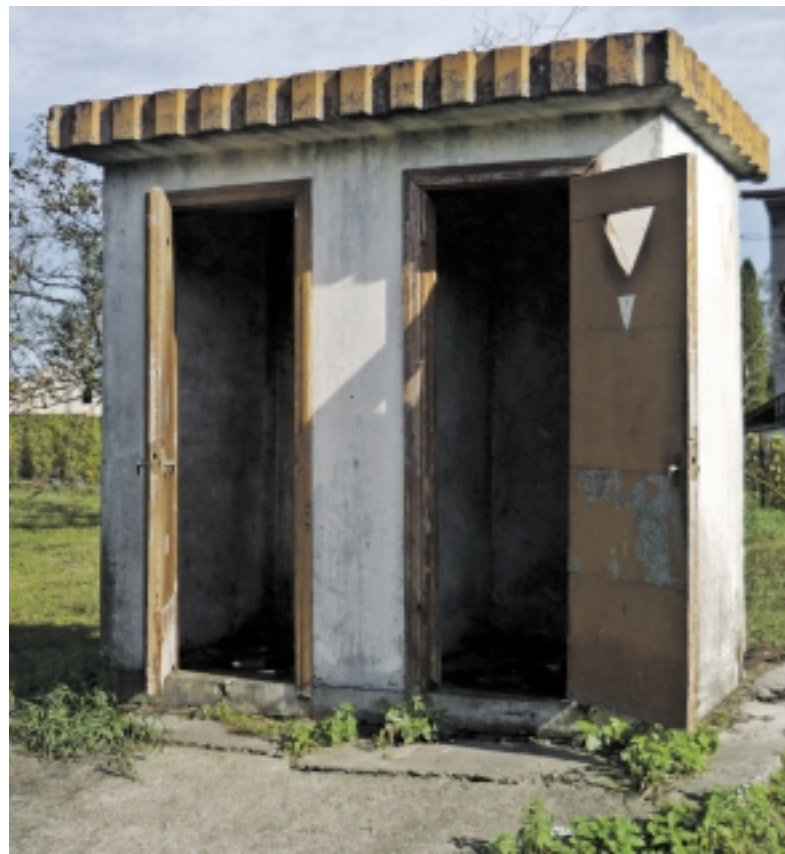
Į prie Pagėgių autobusų stotelės esantį tualetą baisu užėiti...