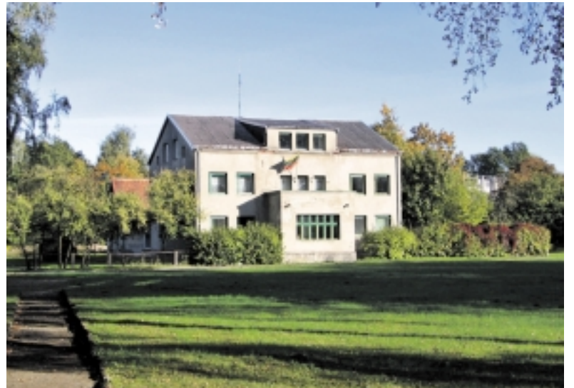
Šiame pastate Atgimimo alėjoje dar metus skambės muzika. Naujieji jo savininkai trina rankomis – 50 tūkstančių litų sumažėjo pastato įsigijimui išleista suma.

Rusnės kultūros namų rekonstrukcija sustojo. Savivaldybė, kaip užsakovas, buvo priversta spresti šią nemalonią ir niekam nereikalingą situaciją. Jei artimiausiu metu Rusnės kultūros rekonstrukcijos darbai nebūtų atnaujinti, grėsė ES struktūrinių fondų finansavimo nutraukimas. Tad po derybų tarp Savivaldybės administracijos ir UAB „Energetikos objektų statyba“ buvo rastas kompromisas – Savivaldybė kaip kompensaciją viešbučio savininkams sumoka 200 tūkstančių litų. Ta suma ir buvo