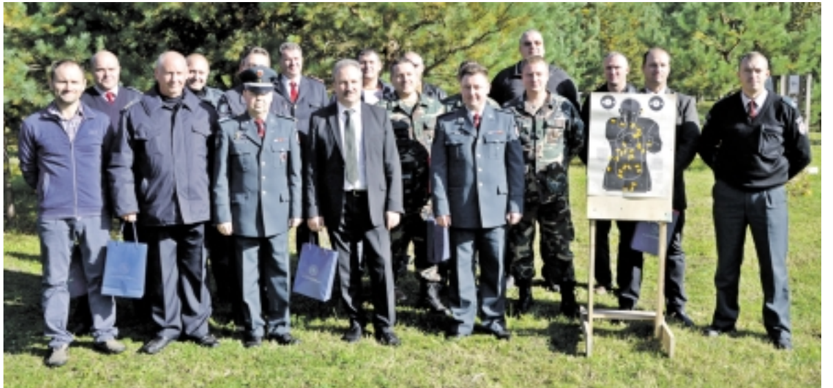
Šaudymo varžybų dalyviai.