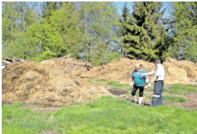
Taip mėšlą laikančius asmenis gali bausti Aplinkos apsaugos agentūros pareigūnai.

Kitas pakeitimas – asmenys, vienoje vietoje laikantys nuo 10 iki 100 sąlyginių galvijų (SG), tirštą mėšlą gali kaupti tirštojo mėšlo rietuvėje prie tvarto, kurioje privalo būti įrengtas nelaidus ir sandarus hidroizoliacinis sluoksnis, užtikrinantis, kad iš rietuvės į aplinką ne-