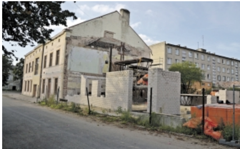
Skilusi pastato siena Rusnėje pridarė rūpesčių pastato savininkams, statybininkams ir Savivaldybei. To kaina – 200 tūkstančių litų.

Viskas prasidėjo praėjusių metų rudenį, kai Šilutės r. savivaldybėje buvo pagaliau apsispręsta tvarkyti Rusnės kultūros namus. Tiksliau, juos statyti kone nuo nulio, nes tai, kas buvo iš jų likę po kelių metų nepriežiūros – netiko niekam.