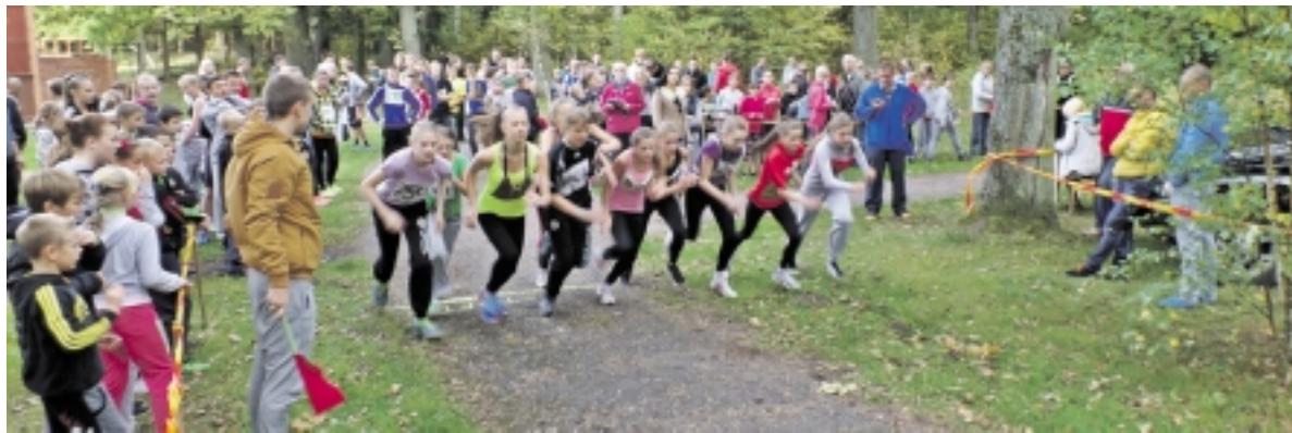
Rudens kroso dalyviai kerta starto liniją.

Rugsėjo 30 dieną įvyko kasmetės rudens kroso varžybos, sukvietusios greičiausias rajono mokyklų mokinius. Šiemet kaip niekada sulauktas gausus bėgikų būrys iš 15 rajono mokyklų bei gimnazijų, kurie susirungė gimusių 2002–2003, 2000–2001, 1998–1999, 1997 ir vyresnių amžiaus grupėse, skirtingų atstumų distancijose.