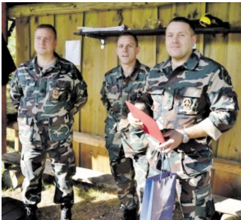
Pirmoji vieta šaudymo varžybose – VSTAT Pagėgių rinktinės komandai.

Taigi šiųmetėse šaudymo varžybose trečiąją vietą užėmė Šilutės r. policijos komisariato komanda. Ant-