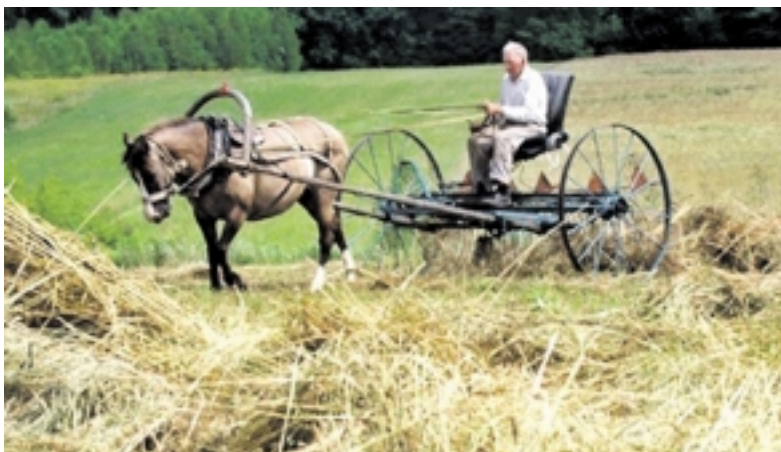
Dar ir dabar Vokietijoje yra taip dirbančių ūkininkų, kaip ir prieš šimtą metų...

Vokietijos žemės ūkis – vienas stipriausių Europoje, o per šimtmetį jame įvykę pokyčiai – milžiniški. Daug pasako vien jau toks faktas: prieš 100 metų vienas ūkininkas Vokietijoje turėjo išmaitinti 4 gyventojus, o šiandien – net 131, tai yra 33 kartus daugiau.