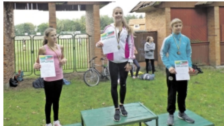
Gimusių 2001–2000 m. grupės mergaitės nugalėtojos.

Suvedus 2014 m. rajono mokyklų rudens kroso komandinių rezultatų išsiaiškinta ir „greičiausia“ mokykla.