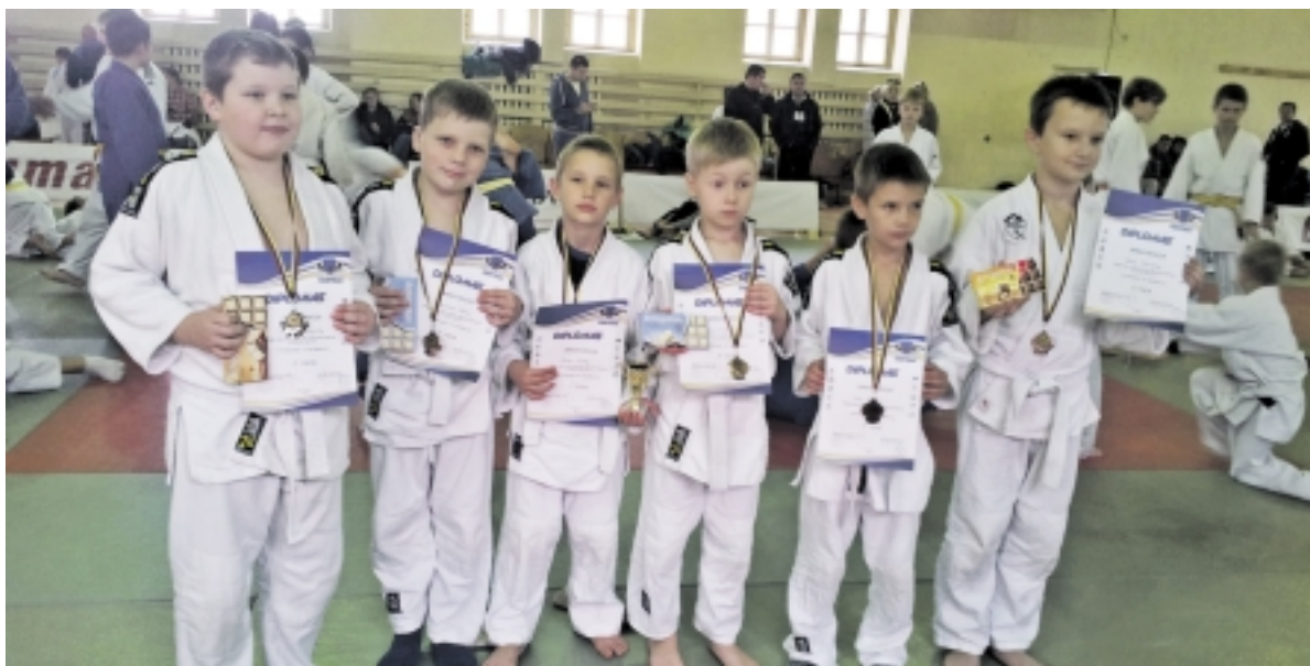
Mažieji „Aukšinio rudens“ čempionai iš Šilutės.

Spalio 4 dieną Plungėje vyko atviros dziudo jaunučių pirmenybės „Aukšinis ruduo“. Dalyvavo sportininkai dviejų amžiaus grupių, gimusių 2002–2003 ir 2004–2007 metais. Pirmieji kovojo jaunesnės amžiaus grupės imtynininkai. Labai ge-